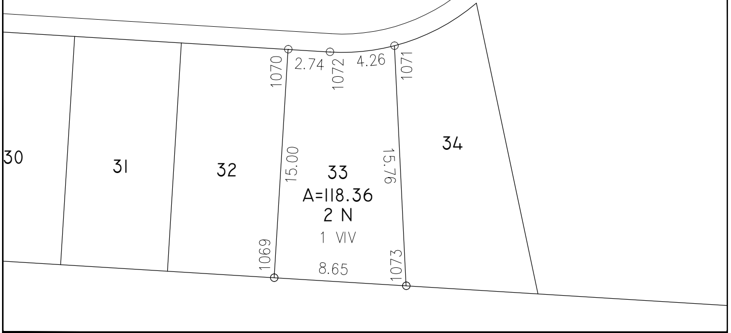
CUADRO DE CONSTRUCCION MANZANA I LOTE 33